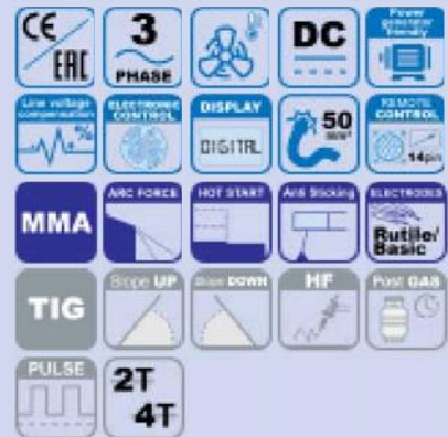
Optional Foot Remote Control